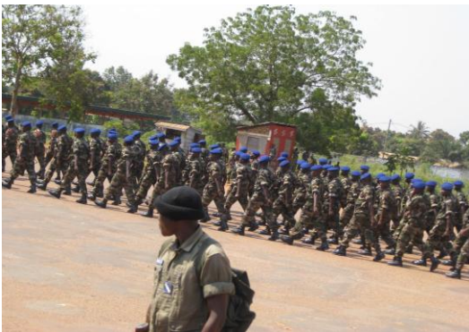
Défilé de l'armée centrafricaine 01/12/2011

Le concept de système de conflits est issu de l'analyse et du suivi des dynamiques de certains conflits contemporains, notamment ceux qui ont marqué le continent africain à partir des années 1990 4 . Un système de conflits se comprend comme un ensemble de conflits, de causes, de formes et de territorialités distinctes, mais qui finissent par s'articuler et s'alimenter sous l'effet de leur proximité, de leurs évolutions ou des alliances tissées par des acteurs divers dont les intérêts convergent 5 .