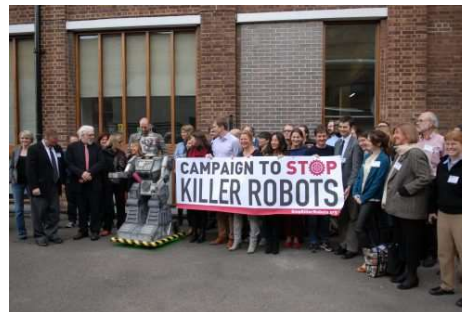
Démarrée en 2012, la Campagne pour interdire les robots tueurs sera-t-elle soutenue davantage par la Belgique en 2021?

A la demande des organisateurs de la Campagne internationale contre les robots tueurs , une enquête a été réalisée par Ipsos, en décembre 2020. Les résultats montrent que 62% des répondants sont contre leur utilisation. En Belgique, ce taux atteint même 66%. Cela confirme le fort soutien de la population belge à une interdiction des robots tueurs. C'est ce qui ressortait déjà des enquêtes réalisées en 2017 et 2018 où 63% des répondants belges avaient déjà exprimé leur opposition. Cependant, l'infographie ci-dessous montre que d'autres nations affichent un taux encore plus élevé d'opposants aux armes manipulées par l'intelligence artificielle.