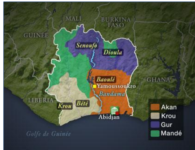
Carte 1 : Les groupes culturels de la Côte d'Ivoire

politique a largement contribué à la réalisation du « miracle ivoirien » sur le plan économique, elle a aussi engendré une nouvelle composition de la société ivoirienne, organisée en une mosaïque ethnique et linguistique.